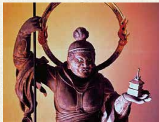
国指定重要文化財 運慶《木造毘沙門天立像》(部分) 1189年、浄楽寺蔵

運慶は、鎌倉幕府という新政権と密接に結びつき、北条氏からの信頼を背景に東国での活躍の場を得ました。鎌倉幕府初代侍所別当・和田義盛の発願による浄楽寺所蔵（1189年）をはじめ、横須賀ゆかりの氏族・三浦一族の造仏にも関与していました。展覧会では、市内に残る国指定重要文化財の運慶作品及びその関連作10余点を展示し、鎌倉幕府と三浦一族の歴史の一端を紹介します。